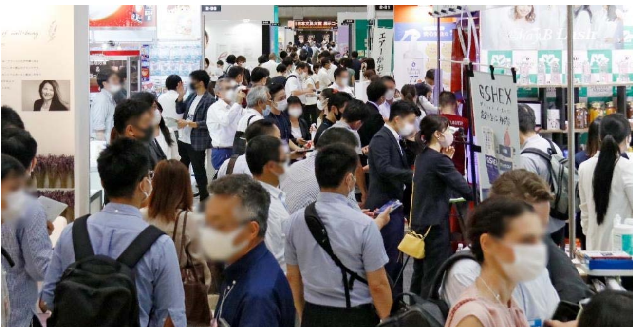
展示会の再開を待っていた多数のバイヤーでにぎわう会場

また、東京都内に勤めている雑貨卸のバイヤーの中には「展示会の初日の様子をホームページで見て、予想以上に多くのバイヤーが来場している事を知って安心した。これなら自分も行って出展企業とで商談したいと思い、すぐに来場した」という方が数多くいた。